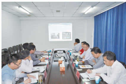
张甜甜 文

会后，大家就后勤机构设置，干部、人才队伍建设，后勤信息化建设，学校绿化养护管理等方面进行了交流。