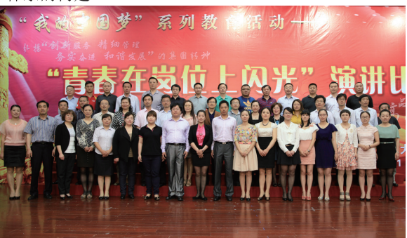
严慕昀 文

团广大青年员工积极投身学校后勤服务工作的热情；旨在用后勤职工中真实的优秀人物和感人事例教育全体干部职工，在集团进一步掀起“学身边人、学身边事”的群众性学先进、赶先进活动的热潮，大力弘扬创新服务、精细管理、务实奋进、和谐发展的集团精神；旨在充分展示集团职工开拓创新、拼搏进取、爱岗敬业、克己奉献的精神风貌和工作作风；旨在通过后勤文化建设，进一步促进“三品型”后勤服务保障体系的构建。