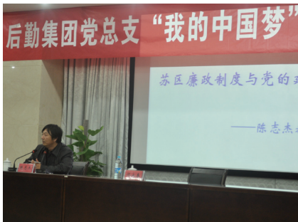
张甜甜 文

谐通大、美丽通大、幸福通大，大力谱写学校、集团科学发展新篇章贡献自己的一份力量。