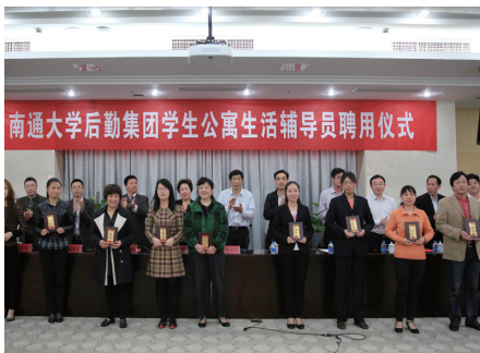
万春红 文

组建学生公寓生活辅导员队伍，是集团2013年的重点工作之一。开展这项工作的目的在于，在履行好公寓管理职能的前提下，把管理职能进一步向服务职能、教育职能延伸，更好地践行“三服务、两育人”的高校后勤工作宗旨，积极构建“三品型”后勤服务保障体系，大力弘扬集团精神，推动集团科学发展，为全面提高学生的自我管理能力和提升学生综合素质，维护校园稳定作出新的、更大的贡献。