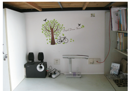
万春红 文

本次大赛通过与后勤职工的合力育人，将素质教育融入公寓管理之中，最大限度地调动了学生的自觉参与和自主管理的热情，更加贴近了学生“自我管理、自我服务、自我教育”的目标。