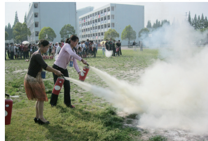
姚媛媛 曹丹文 姚媛媛 摄影

通过参加灭火技能培训，学生生活辅导员和保洁人员掌握了消防灭火器材的正确使用方法，消防安全意识进一步增强，消防安全基本知识也得到进一步充实，公寓消防安全得到进一步保障。